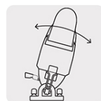
Capacidad de biselado 0 - 45° por ambos lados