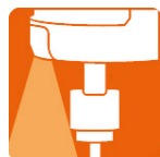
LED para iluminar el área de trabajo